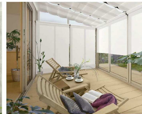
テラス囲い/リウッドデッキ 納まり/フラット型(積雪～20cm地域用)/関東間/間口2間×奥行9尺/正面・両側面:引違い窓/プラチナステン(ポリカーボネート板) 部材標準販売価格 ¥1,314,100 リウッドデッキ 200:間口3間×奥行12尺/ホワイトブラウン 含む(オプションを除く)

※「サンフィールⅢ」は強い雨や風、結露に対する考慮はしていません。特にサンルームとして居室に使用することは避けてください。 ※また、使用しないときは、家具などを室内にしまってください。