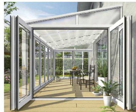
テラス囲い/リウッドデッキ 納まり/フラット型(積雪～20cm地域用)/関東間/間口2間×奥行9尺/正面・両側面:折りたたみ戸/ホワイト(ポリカーボネート板) 部材標準販売価格 ¥2,395,600 リウッドデッキ 200:間口3間×奥行12尺/ホワイトブラウン 含む(オプションを除く)