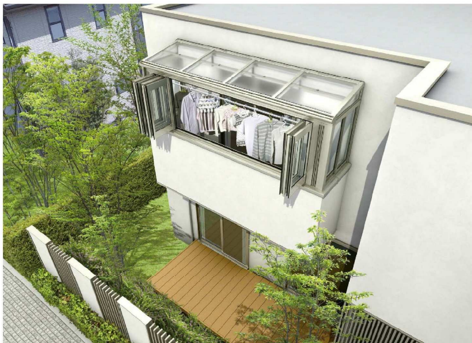
躯体式バルコニー囲い/フラット型(積雪～20cm地域用)/ 関東間/間口2間×奥行3.3尺/正面:折りたたみ戸・両側面:高窓/笠木ユニット(平笠木200mm幅)/プラチナステン(ポリカーボネート板) 部材標準販売価格 ¥786,900